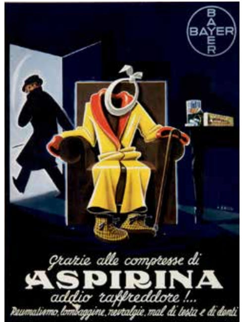
R. Bassi, Almanacco Bayer, 1937, Arti grafiche Bertarelli, Milano Museo e Centro studi storico-farmaceutici "Angelo Beccarelli"

in un contesto di scarsa regolamentazione e forte fiducia nell'autorità medica. I rimedi venivano presentati come sicuri, risolutivi e privi di rischi.